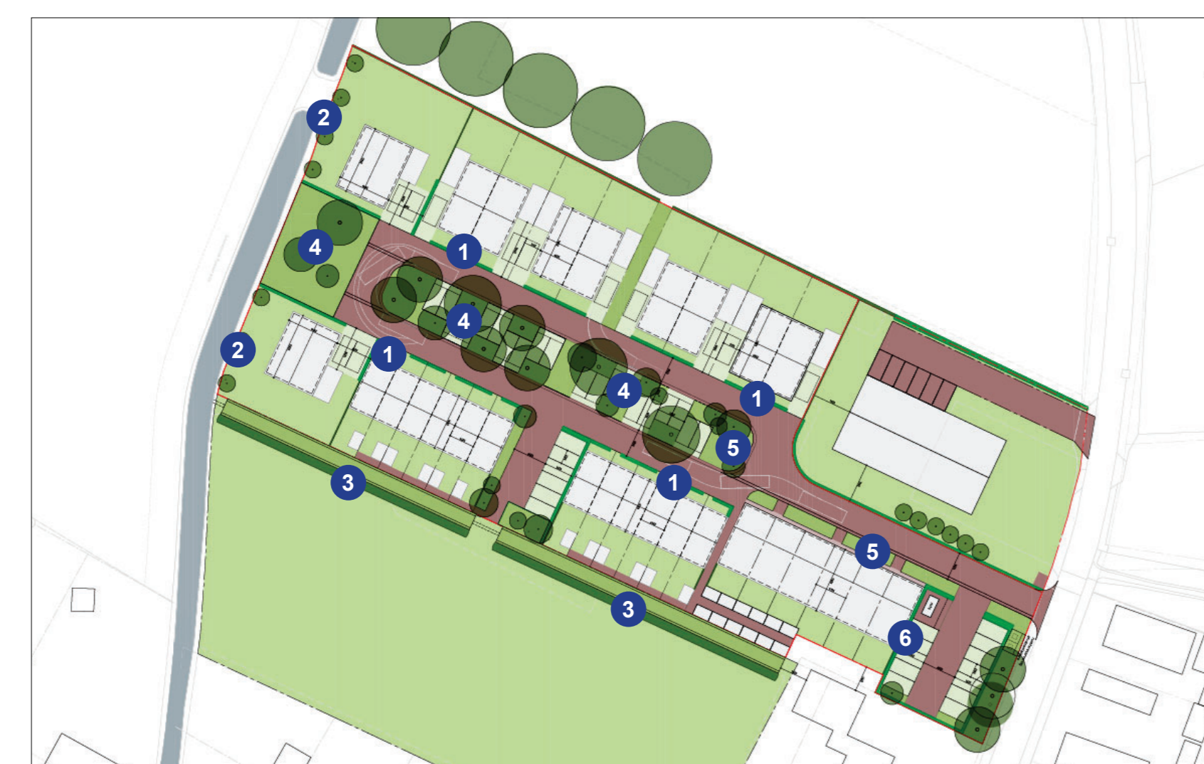
Figuur (40) Erfinrichtingsplan.