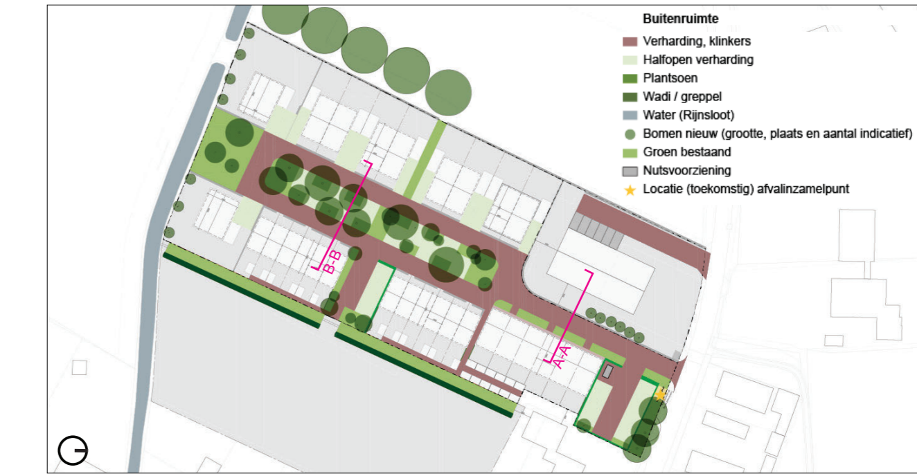
Figuur (38) Buitenruimte.

De verlichting dient eenvoudig te zijn qua vormgeving en dient het dorpe karakter te ondersteunen. De verlichting dient diervriendelijk te zijn.