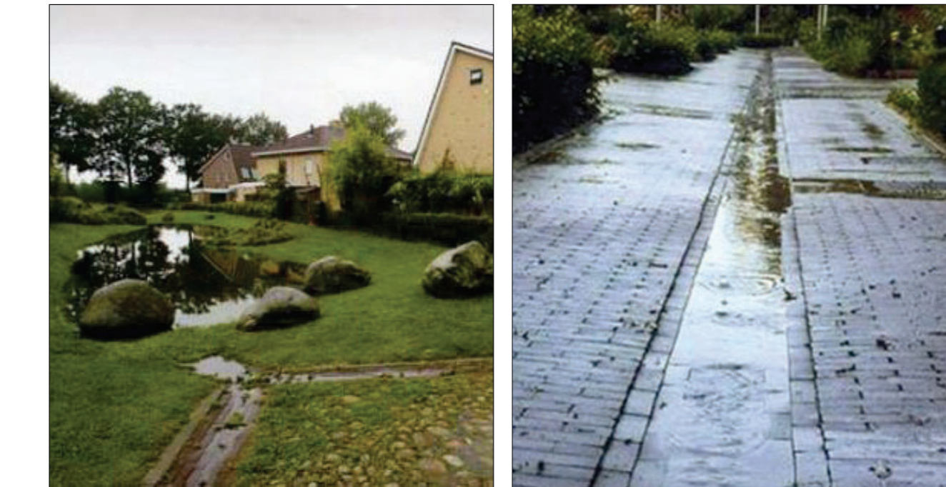
Figuur (39) Wadi en hemelwater afvoer.