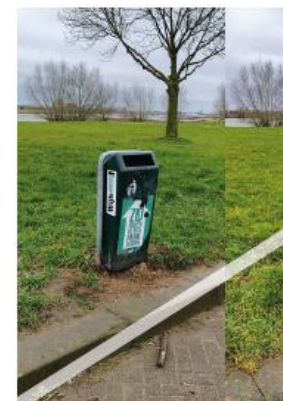
Niet gewenst: grote diversiteit aan afvalbakken (max. twee types toepassen, zie hiernaast)