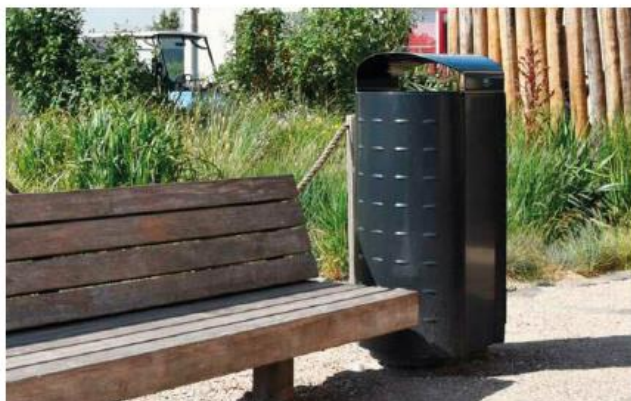
Voorbeeld bijpassend type afvalbak voor binnenstadside plangebied