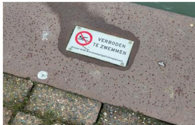
Vlakte aansluiting bestrating op kaderand, verbodsteken geïntegreerd in kaderand