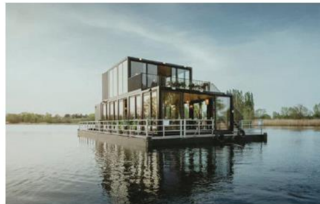
Vaartuig met eenvoudige hoofdvorm en symmetrische hoofdopzet, gevels van metaal en glas (hoogte boven waterlijn wijkt af van voorschriften)