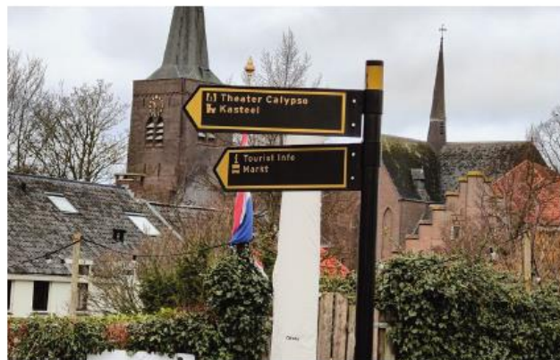
Eén type toeristische wegwijzers voor de Stadshaven en de rest van Wijk bij Duurstede