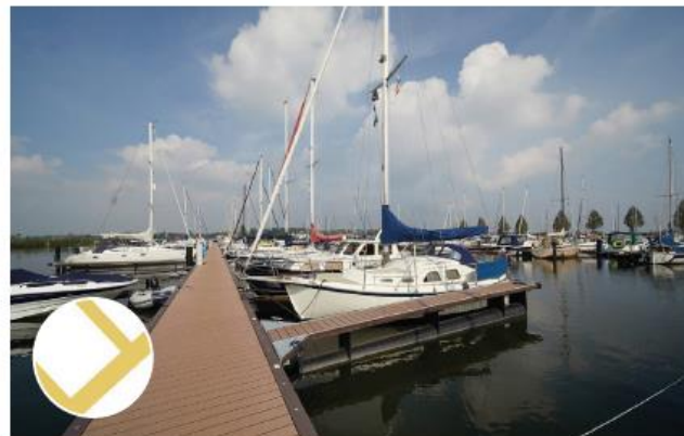
Drijfsteigers in eenduidige materialisering (type Inter Boat Atlantic, gelijk aan bestaande drijfsteigers Stadshaven)