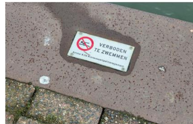
Ge- en verbodsaanduidingen bij voorkeur geïntegreerd in andere elementen.