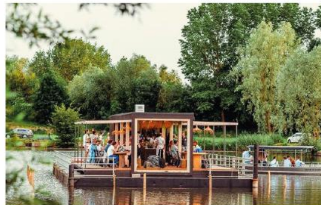
Vaartuig met eenvoudige hoofdvorm en symmetrische hoofdopzet, gevels van hout, metaal en glas, zonneschermen als overkapping