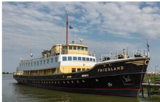
Voorbeeld van een traditioneel type schip dat zonder toevoegingen en opbouwen passend kan zijn als horecaschip