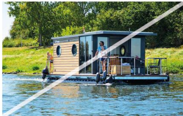
Niet gewenst: vaartuigen die geen scheepsvorm hebben in de Stadshaven (zie onder 'Schepen', 1b.)