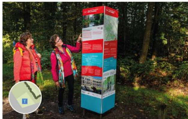
TOP-informatiezuil (2x in plangebied) volgens actuele vormgeving Provincie Utrecht