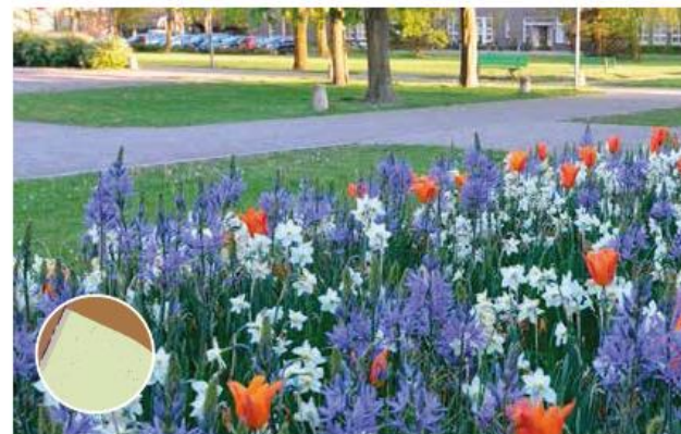
Intensiever beheerd groen bij entree binnenstad