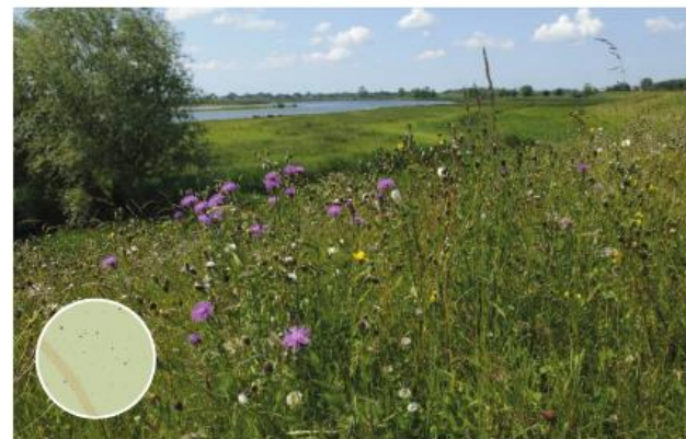
Extensief beheerd bloemrijk grasland in rivierengebied, basis voor groen in het gebied