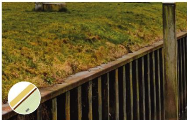
Bestaande kades: stalen damwand met stalen afwerking