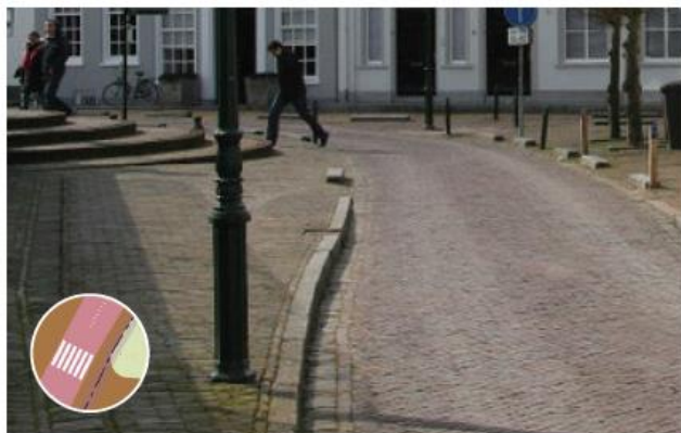
Voetpaden in verbinding met binnenstad: bruine klinkerbestrating aansluitend bij trottoirs binnenstad