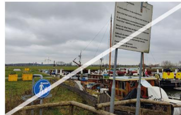
Niet gewenst: onsamenhangende en uiteenlopende borden