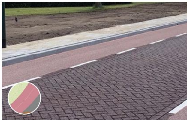
Gekleurd asfalt met reliëf (streetprint) versterkt karakter als verblijfsgebied en verbijzondert de Havenweg