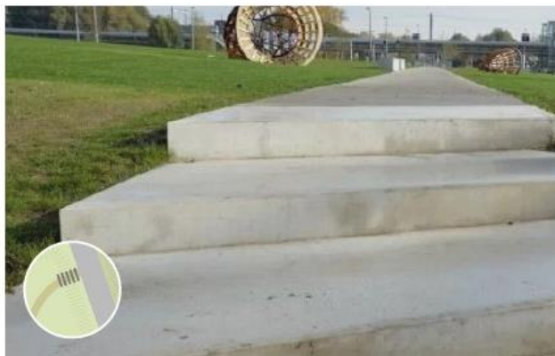
Betonnen treden t.p.v. hoogteverschillen in struipaden