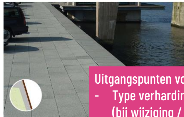
Betonpaden (m.u.v. oostzijde): hoogwaterbestendig uitvoeren, niet-standaard formaat (voorbeeld: Struyk Verwo Hydro Lineo)