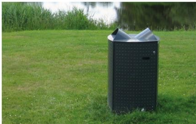
Voorbeeld afvalbak rivierzijde (op basis van standaard rolcontainer, in winter te verwijderen van betonvoet)