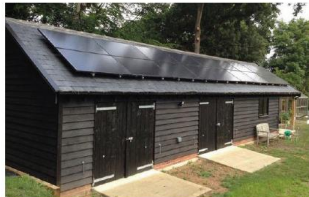
Voorbeeld van een nieuwbouwvolume passend bij de gebouwen in de stadshaven (dakbedekking wijkt af, leien niet gewenst)