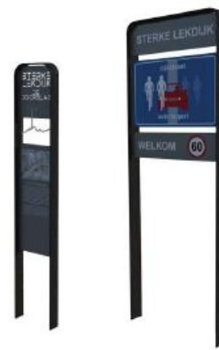
Informatie en ge- en verbodsaanduidingen in eenduidige vormgeving en samenhang met BKP Sterke Lekdijk (rand bij voorkeur zwartgrijs in Stadshavengebied)