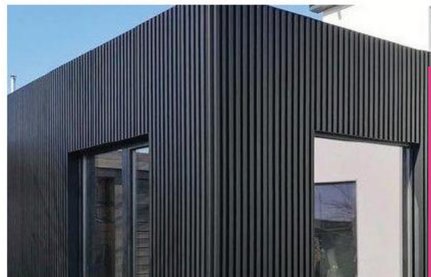
Metalen gevel als alternatief, indien hout niet wenselijk is