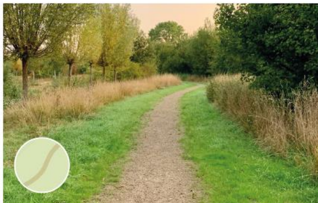
Informele voetpaden in haven: halfverharding Komex of Graustabiol of vergelijkbaar, hoogwaterbestendig uitvoeren