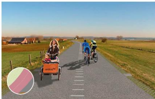
Basisprofiel 'breed' in BKP Sterke Lekdijk als inspiratiebron