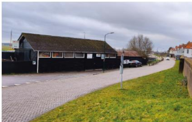
Samengesteld bouwvolume bij bestaande werf: verschillende rechthoekige volumes hebben een kap in de langrichting op onderling verschillende hoogtes