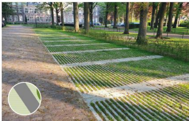
Parkeerterreinen: bij herinrichting parkeervakken in open bestrating, lineaire structuur (voorbeeld: Struyk Verwo Hydro Lineo)