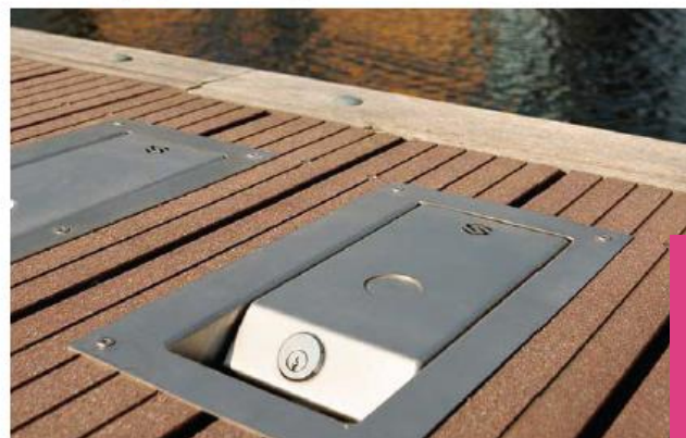
Nutsaansluitingen geïntegreerd in steigers