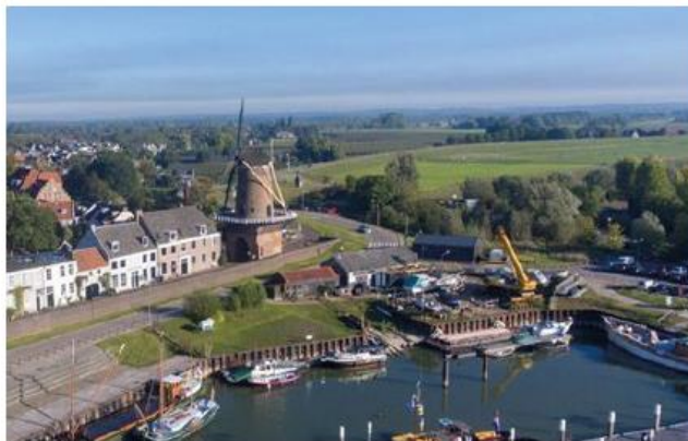
Bestaande situatie met een tweetal eenvoudige gebouwen in zwart hout en met hellende daken in de lengterichting, ondergeschikt in de beleving van het gebied