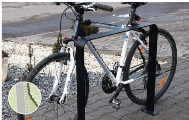
Fietsenbeugels in zwartgrijs (passend bij vormgeving BKP Sterke Lekdijk)