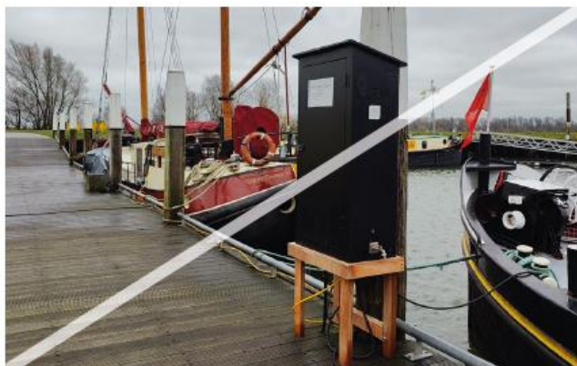
Niet gewenst: nutsvoorzieningen te aanwezig op de steigers en niet geïntegreerd in het ontwerp