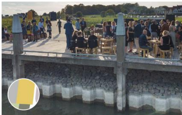
Vaste steiger met houten constructie