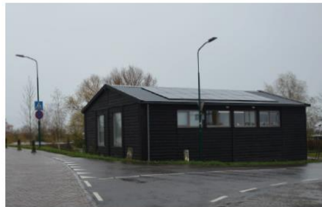
Houten gevel, hellend dak en kozijnen met een weinig opvallende, grijzige kleur