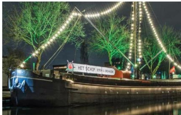
Voorbeeld horecaschip op basis van traditioneel binnenvaartschip